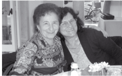
Due immagini dei partecipanti all'incontro