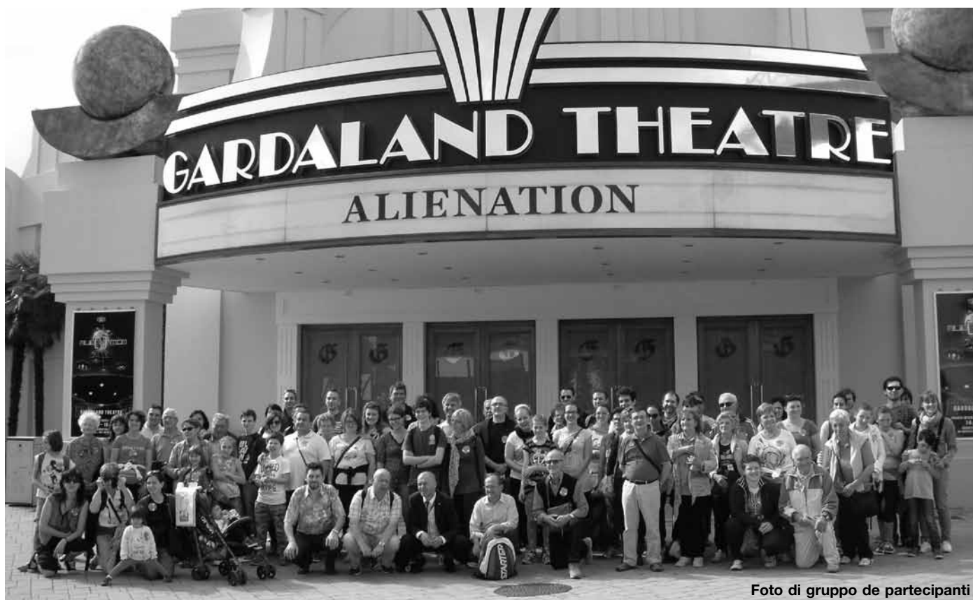
Foto di gruppo de partecipanti

Circa 150 le prenotazioni a Gardaland per il primo incontro ufficiale delle FAMIGLIE MOLON in Italia