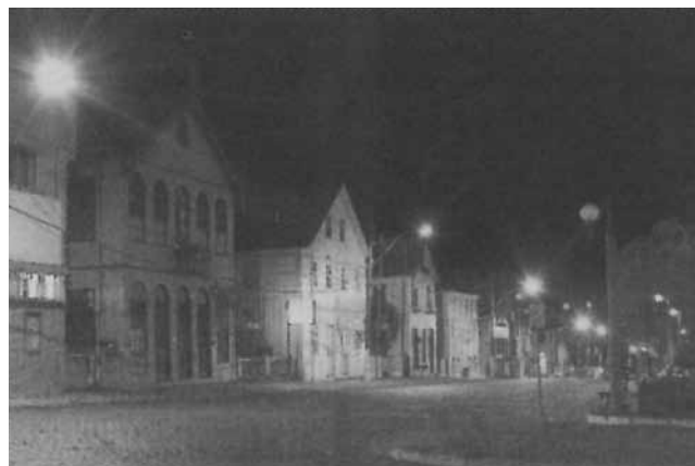
Una veduta notturna del centro storico della città di Antonio Prado