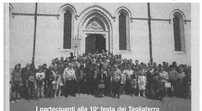
I partecipanti alla 10ª festa dei Tagliaferro

Tratto dal Giornale di Vicenza del 30 aprile 2014