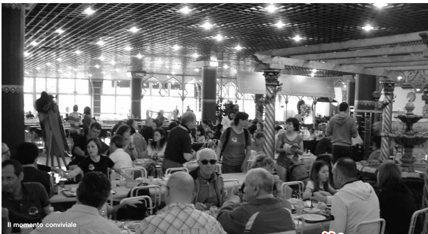
Il momento conviviale