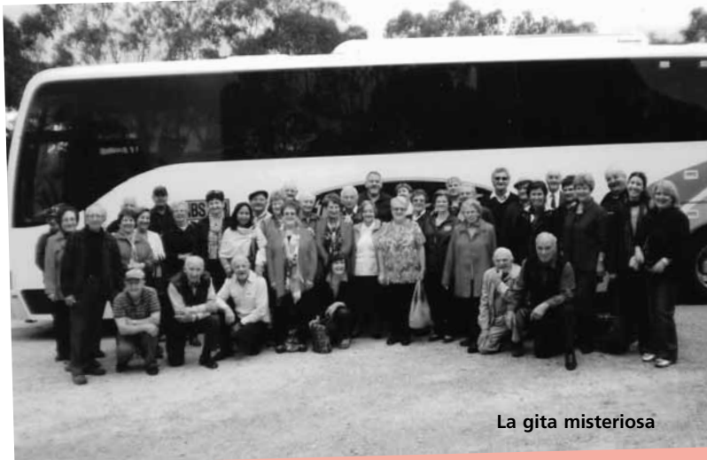
La gita misteriosa