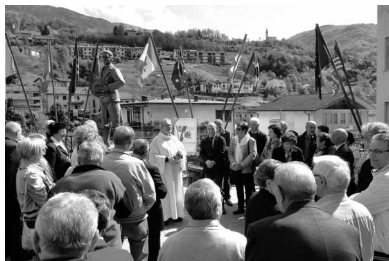
Due momenti dell'omaggio al Monumento dell'Emigrante