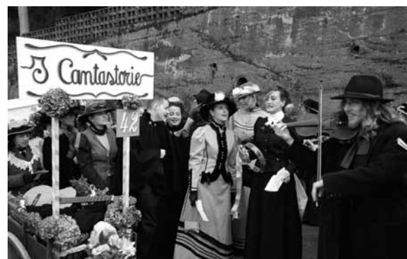
Nelle foto, in ordine dall'alto a sinistra: "migranti"; ...bandoti de marso; "boce e moneghe"; "cantastorie".

il centro potevano ammirare le vetrine che partecipavano al concorso "La vetrina della Chiamata di Marzo" ed erano dei piccoli capolavori dell'arte e dei mestieri del passato.