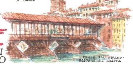
PONTE PALLADIANO -BOSSANO DEL GRAPPA-