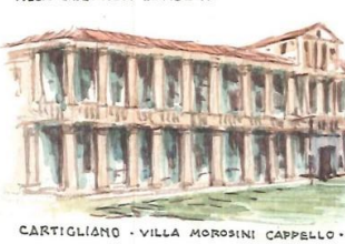
CARTIGLIANO - VILLA MOROSINI CAPELLO -