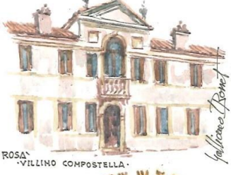
ROSA -VILLINO COMPOSTELLA-