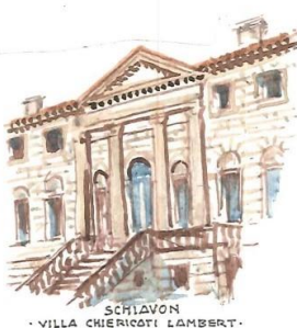
SCHIAVON -VILLA CHIEROTTI LAMBERT-