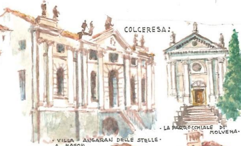
VILLA ANGARAN DELLE STELLE A MASON