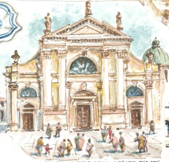
MAROSTICA - LA PIEVE DI S. MARIA LA PIÙ ANTICA DELLA CITA' ORIGINI: DAL IV-VECO. D.C.