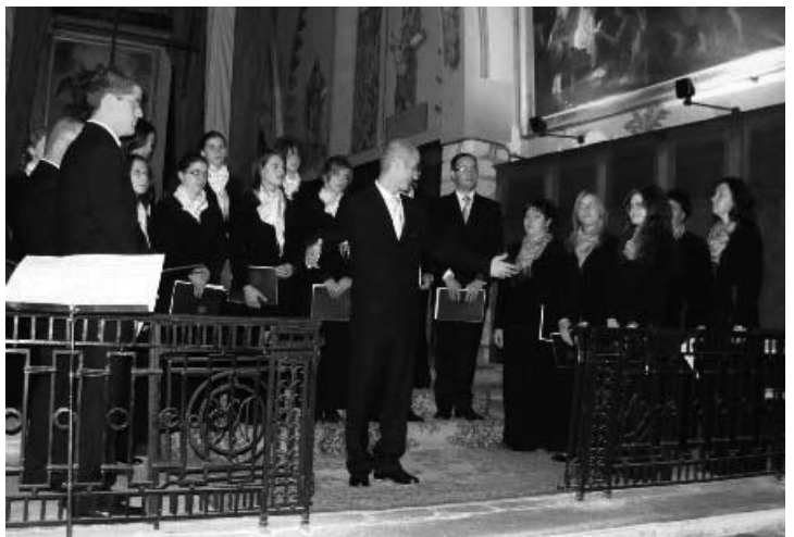
L'esibizione del coro