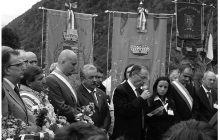
Un momento della cerimonia di commemorazione